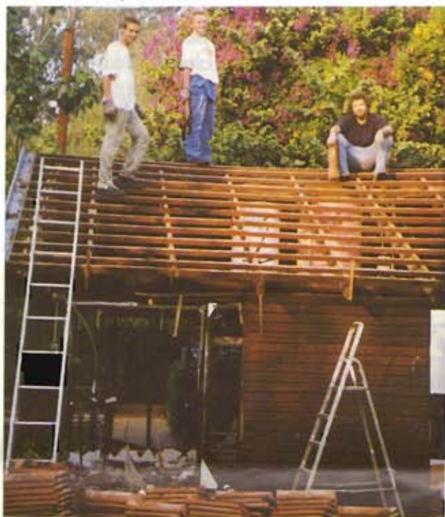
„Zivis“ Christian und Markus mit Meinrad Bauer beim Abbruch des Dusch- und Toilettenhauses

Beit Noah im richtigen Zeitpunkt. Ein Architekt aus Deutschland hatte im Sommer kostenlos eine Bestandsstudie mit einem Neuentwurf entwickelt. Dieser Entwurf soll nun der israelischen Baubehörde zur Genehmigung eingereicht werden, damit im Oktober 2001 die Bauarbeiten beginnen können. Im Vorfeld sind wir gerade dabei, das Dusch- und Toilettenhaus auf dem Platz der Begegnungsstätte neu zu bauen. Nach langem Dauerbetrieb war die Holzkonstruktion im Bodenbereich morsch und faul und mit der schadhafte Elektroanlage zum Sicherheitsrisiko geworden. Nun soll das Häuschen aus Stein neu aufgebaut werden. Trotz unserer Eigenleistung, wie Abbruch, Wiederverwendung der Dachziegel, Anstricharbeiten, wird diese Baumaßnahme rund DM 100.000,- kosten.