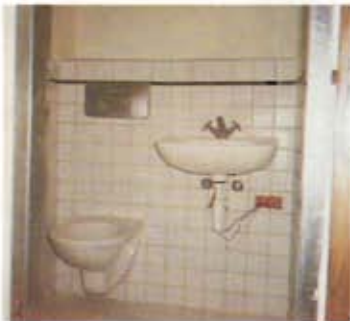
Erneuerte Naßzelle

Schließlich wird versucht, dem ganzen Haus durch eine geeignete neue Beleuchtung, durch Glasabschlüsse mit größerer Transparenz, durch Anstriche und nicht zuletzt mit einer neuen Einrichtung eine Atmosphäre der Konzentration und Offenheit zu geben. Dazu werden die Möbel in den Studierzimmern zum Beispiel nach eigenen Entwürfen von palästinensischen Schreibern gefertigt – Maßgeschneidertes -. Vielleicht gelingt es, daß sich im „neuen“ alten Beit Josef das Notwendige mit dem Nützlichen und Schönen zum Wohl der Lehrenden und Studierenden vereinen.