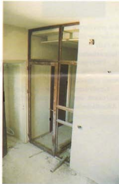
Neue Flurabschlüsse in allen Etagen, Foto: Alois Peitz

Das Sommersemester des Studienjahres 1999/2000 konnte dankenswerterweise im ehemaligen Internat der Borromäerinnen untergebracht werden, so daß Beit Josef den Bauleuten von Mai bis November diesen Jahres zur „freien“ Verfügung steht.