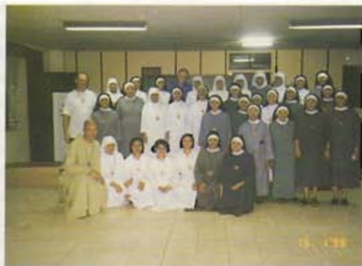
Dieses Photo entstand an einem gemeinsamen Abend im Priorat Ulas bei Davao im Süden des Landes