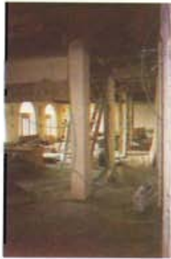
Blick in den erweiterten Hörsaal – rechts: der ehemalige Flur zur Bibliothek,