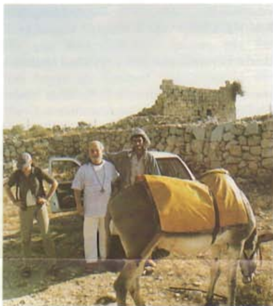
Empfang durch einen Beduinen in Bet El.

Benediktiner der Abtei auf dem Berg Zion in Jerusalem übergegangen, wie ein Auszug aus dem Kuschan - Grundbuch - nachweist. Sie sind damit gleichsam in die Nachfolge der Patriarchen Abraham und Jakob getreten und besitzen ein Stück Land von höchst religionsgeschichtlichen Wert. Die Fläche des Besitzes beträgt etwas mehr als 10.000 qm und liegt heute im autonomen palästinensischen Gebiet von Ramallah. Von 1967 bis 1997 stand das Gelände unter der israelischen Militärverwaltung. Bis dahin durften aus Sicherheitsgründen keine Aktivitäten entwickelt werden. Heute steht der benediktinische Besitz von Bet-El im Prospekt der „Palästinensischen Vereinigung für kulturellen Austausch“ an erster Stelle der Sehenswürdigkeiten auf palästinensischem Boden. Von der palästinensischen Seite sähe man es gerne, wenn sich dort Aktivitäten entwickeln würden.