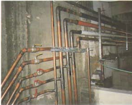
„Ad multos annos“- Das neue Leitungsnetz im Beit Josef