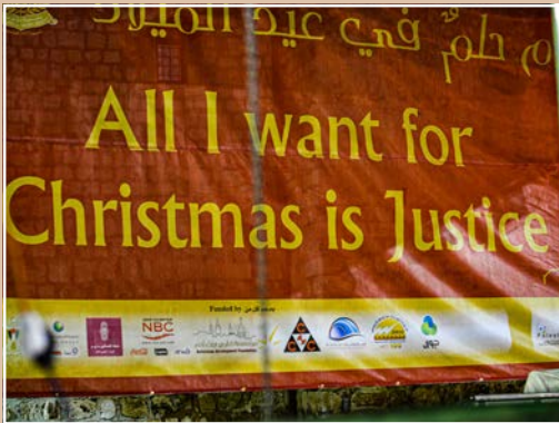
„All I want for Christmas is Justice“, Gerechtigkeit als Weihnachtswunsch – Transparent am Straßenrand nach Betlehem in der Heiligen Nacht 2014.