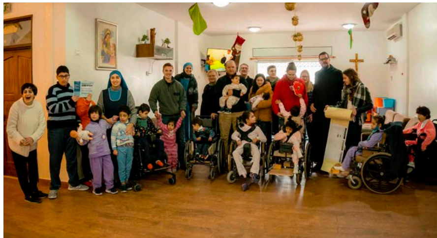
Schon 2017 konnten wir dem Hogar Niño Dios einen Spendenscheck im Namen der Teilnehmer der Weihnachtsaktion überreichen und möchten das sehr gerne auch an diesem Weihnachtsfest tun.

Die beiden anderen Einrichtungen, die wir in diesem Jahr durch unseren Spendenaufwurf unterstützten möchten, kennen wir durch zahlreiche Begegnungen in Tabgha und Besuche in Betlehem. In der Tageseinrichtung Ma'an Lil Hayat, deren Name übersetzt „Gemeinsam für das Leben“ bedeutet, werden jun-