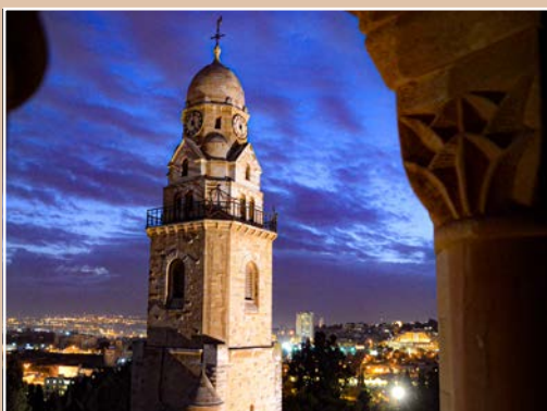
Wächter auf Zion: Der Glockenturm der Dormitio blickt Tag und Nacht weit über Jerusalem und das Heilige Land.

Wir stehen nun im Advent 2020, der uns zum Weihnachtsfest 2020 führt. Während ich diese Zeilen in Trier schreibe, diskutieren die Politiker in Deutschland über die weiteren Schutz-Maßnahmen und mancher Journalist fragt, wie man Weihnachten retten könne. Das klingt befremdlich! Weihnachten retten? Weihnachten ist doch gerade das Fest, an dem wir die Geburt unseres Retters feiern! Ich weiß, das ist die Perspektive eines Mönches, der auch in der Mitte seines Lebens weiterhin versucht, sein Leben in den Spuren dieses Kindes, das in jener Nacht geboren wurde, zu gestalten. Natürlich ist das nicht die vorrangige Sichtweise der meisten Politiker und Journalisten, schon gar nicht der Wirtschaft oder einer breiteren Öffentlichkeit. – Aber mit den Propheten und Dichtern aller Generationen ist das etwas, was gerade unser Leben als Mönche prägt: Die Spuren Gottes, der ein Gott mitten unter uns sein will, in unserer jeweiligen Zeit aufzuzeigen.