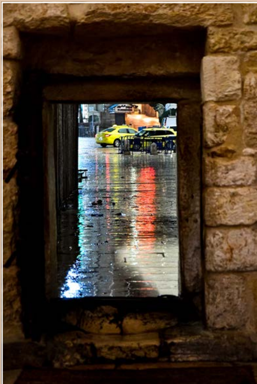
„Tor der Demut“: Blick aus dem kleinen Eingangstürchen der Geburtskirche in Betlehem hinaus auf den Krippenplatz.