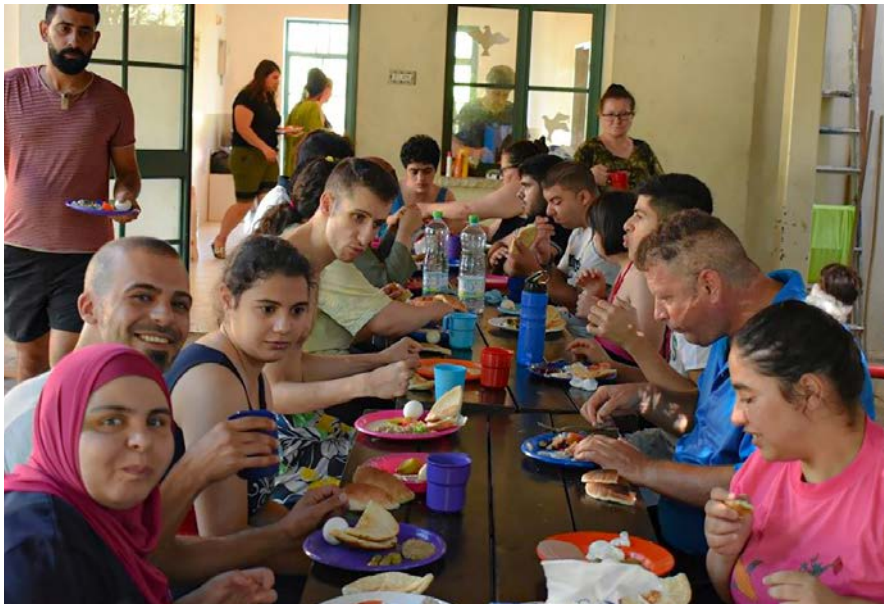
Eine Gruppe von Ma'an Lil Hayat beim Mittagessen unter dem Vordach unserer Begegnungsstätte Beit Noah in Tabgha. Ihnen und ihrer Arbeit soll in diesem Jahr ein Teil der Spenden aus der Weihnachtsaktion zugute kommen.

ge Erwachsene mit Behinderung betreut. In Werkstätten erlernen sie verschiedene handwerkliche Tätigkeiten, und die von ihnen hergestellten Souvenirs verkaufen wir in unseren Läden. Besonders ans Herzen gewachsen ist uns in den letzten Jahren auch Hogar Niño Dios. In diesem von libanesischen und lateinamerikanischen Schwestern geleiteten ärmlichen Heim finden schwerstbehinderte Kinder, deren Familien sich nicht mehr um sie kümmern können oder wollen, ein liebevolles Zuhause. Schon bei ihrem ersten Besuch im Beit Noah vor einigen Jahren fielen sie uns auf, denn die Schwestern, die Volontäre und auch die Kinder strahlen eine unglaubliche Lebensfreude aus.