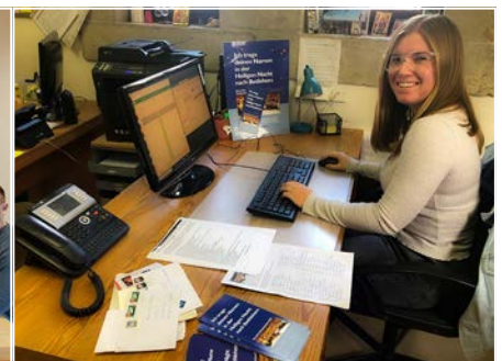
Der Einsatz und die Freude Freiwilliger gehören unbedingt zum Gelingen der Weihnachtsaktion: In Dormagen wurde das Info-Material eingetütet und verschickt. Bald darauf schon wurden in der Dormitio die ersten Namen in die Liste eingetragen.