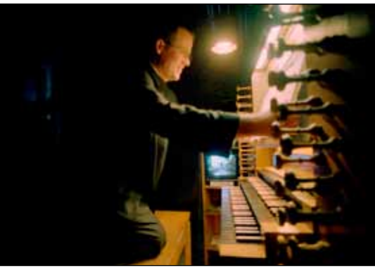
Aus der Dormitio nicht mehr wegdenken: die Orgel. – Die Medaille des Mount Zion Award. – Festgottesdienst am 21. März 2006.

auf bislang unbekannte Fundament- und Gebäudeteile unserer Vorgängerbauten, und die Dormitio begegnet ihrer eigenen, reichen Geschichte.