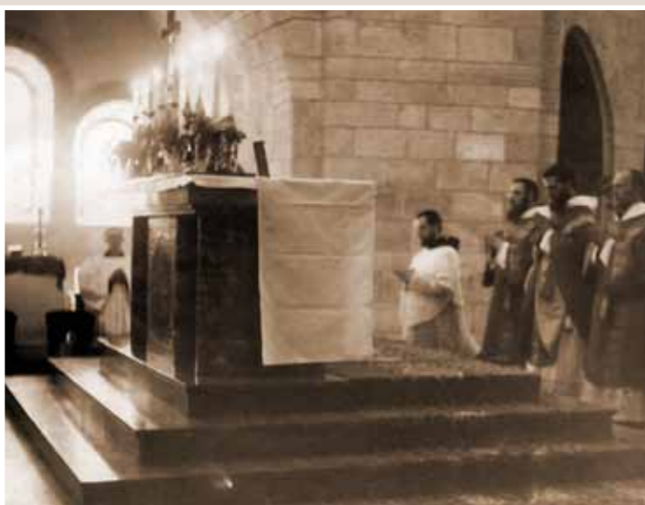
Liturgie am Hochaltar (nach 1938).