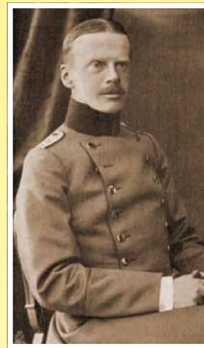
Prinz Georg Franz Josef Luitpold Maria Prinz von Bayern (1880-1943)

[...] Am Vorabend wurde das Fest nach katholischem Brauche mit den tags zuvor geweihten Glocken feierlich eingeläutet. Es war, als riefen die Glocken der heiligen Stadt zu: „Lauda Jerusalem Dominum, lauda Deum tuum Sion.“ Überreich sinnreich sind die Gebete und Gesänge sowie die Zeremonien, welche die Kirche für die Konsekration der Kirchen und Altäre vorgeschrieben hat und lange dauern diese Zeremonien. Neben der Kirche und dem Hochaltare sollten noch sieben Altäre, sechs in der Oberkirche und einer in der Krypta konsekriert werden.