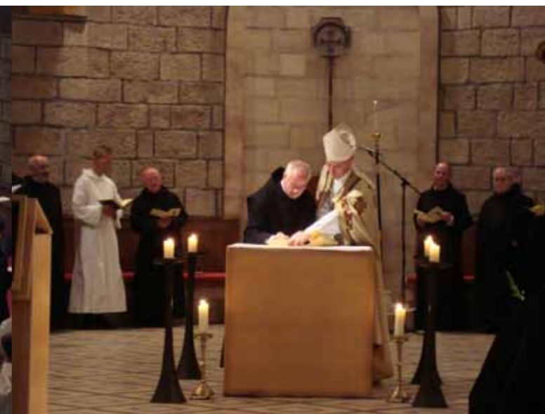
Seit 2003 steht das nächste Provisorium in unserem Chor.