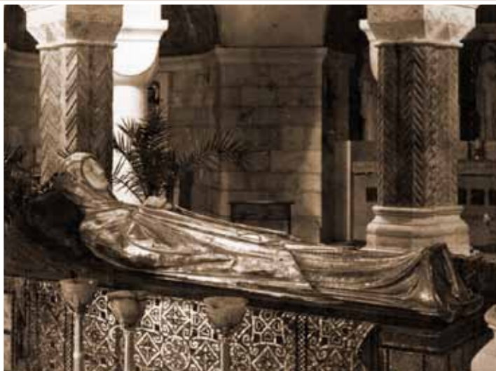
Die Marienfigur der Krypta noch mit dem ursprünglichen silbernen Beschlag.