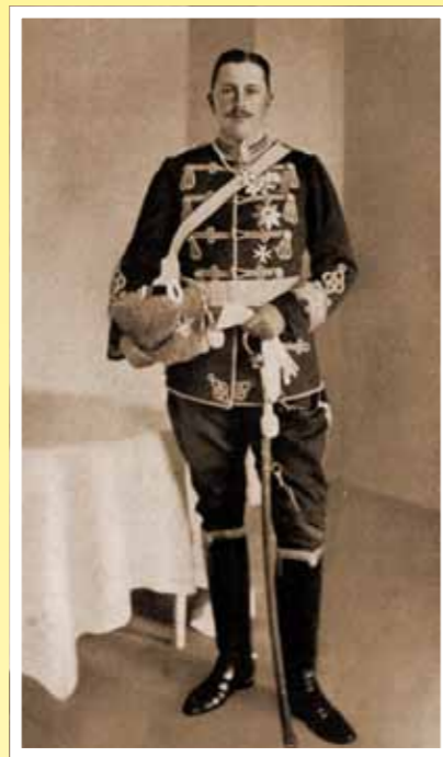
Prinz Wilhelm Eitel Friedrich Christian Karl von Preußen (1883-1942)