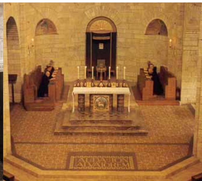
...1938 dieser zweite Hochaltar.