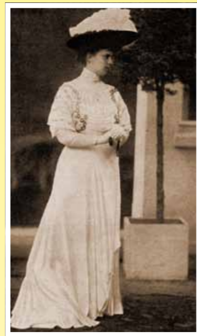
Prinzessin Eitel Friedrich, Sophie Charlotte von Oldenburg (1879-1964)