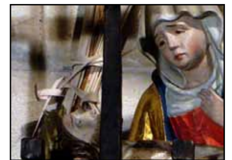
Die Tochter Zion ist in aller Welt zuhause: Tschenstochau, Rom, Kohlhagen, Guadalupe – und auf dem Zion (von oben nach unten).