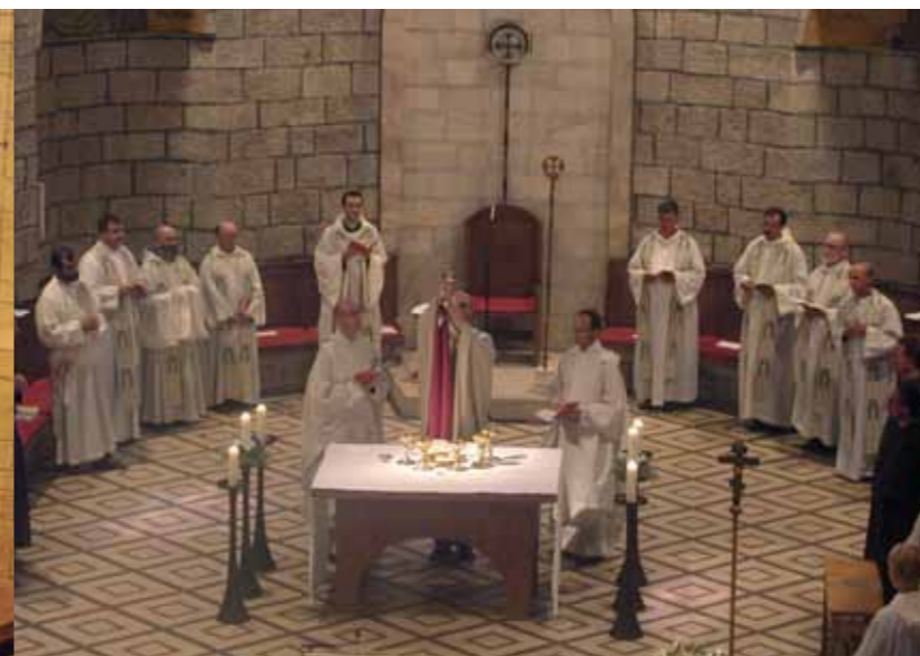
1970 nahm dieser „bewegliche Altar“ seinen Weg in die Dormitio.