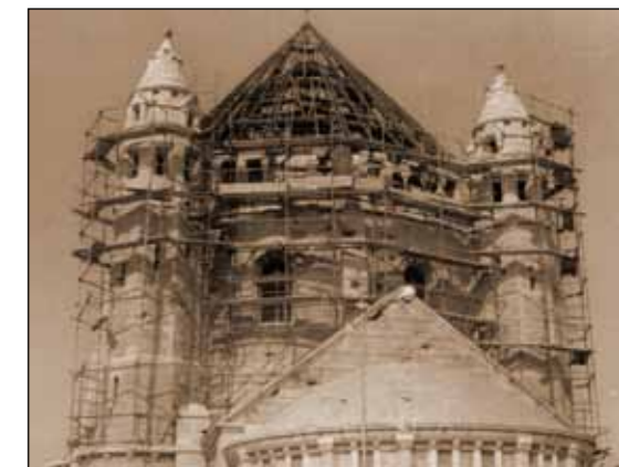
Immer wieder Kriegsspuren: Der zerschossene Glockenturm nach 1948. Reparatur und Wiederaufbau des Dachstuhls über der Kirchenkuppel.

1984/85 beginnen mit den Ausschachtungs- und Ausgrabungsarbeiten auf dem Gelände des so genannten „Amerikanischen Friedhofs“ die Arbeiten für den dringend notwendigen Erweiterungsbau für einen Klosterladen, Büros und Gästezimmer. Bei diesen Arbeiten stößt man