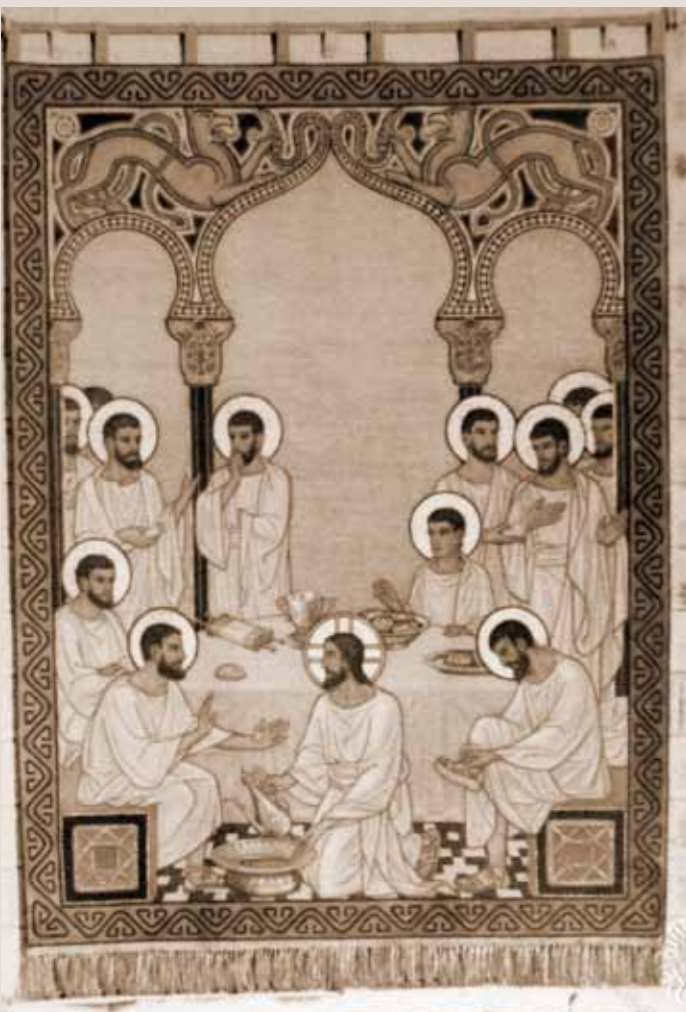
Das Motiv der Fußwaschung: Die vier großen Bilder, die Br. Radbod für die vier großen Bögen des zweiten Stockwerks der Rotunde geschaffen hat, gelten als verschollen.