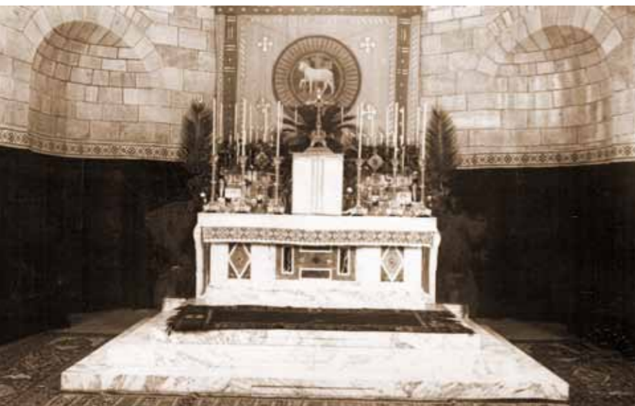
Dem ersten Hochaltar von 1910 folgte (mit einem Zwischen-Provisorium)...