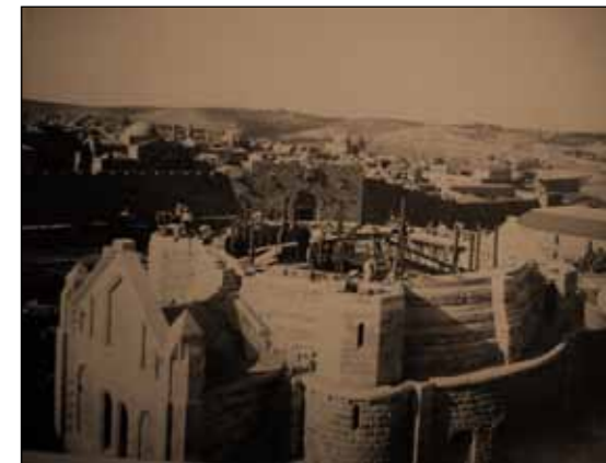
Bilder vom Bau der Dormitio.