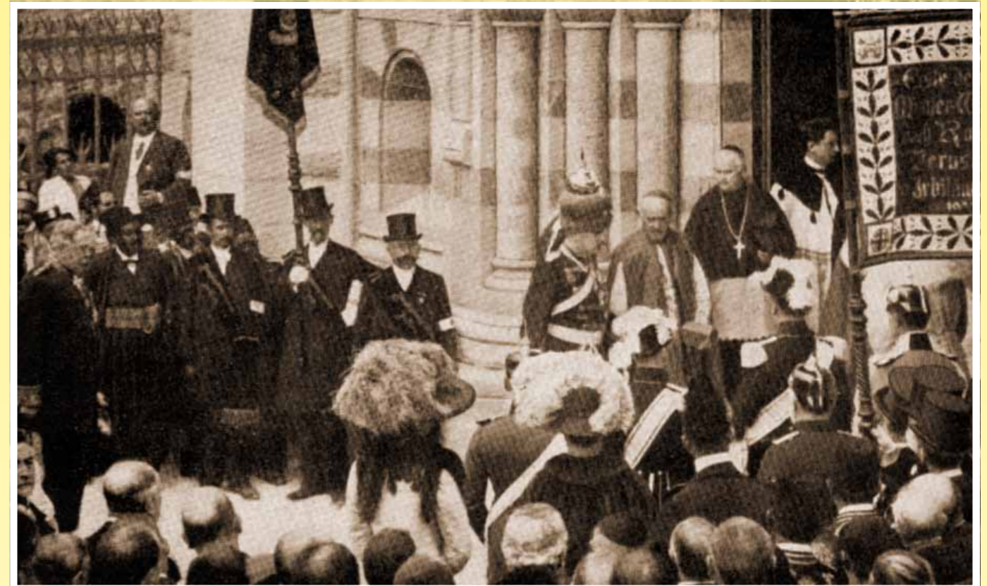
Begrüßung des Prinzen Eitel Friedrich von Preußen am Portal der Dormitio

Klosterladen@Schottenstift.at Fax +43.1.534 98-265